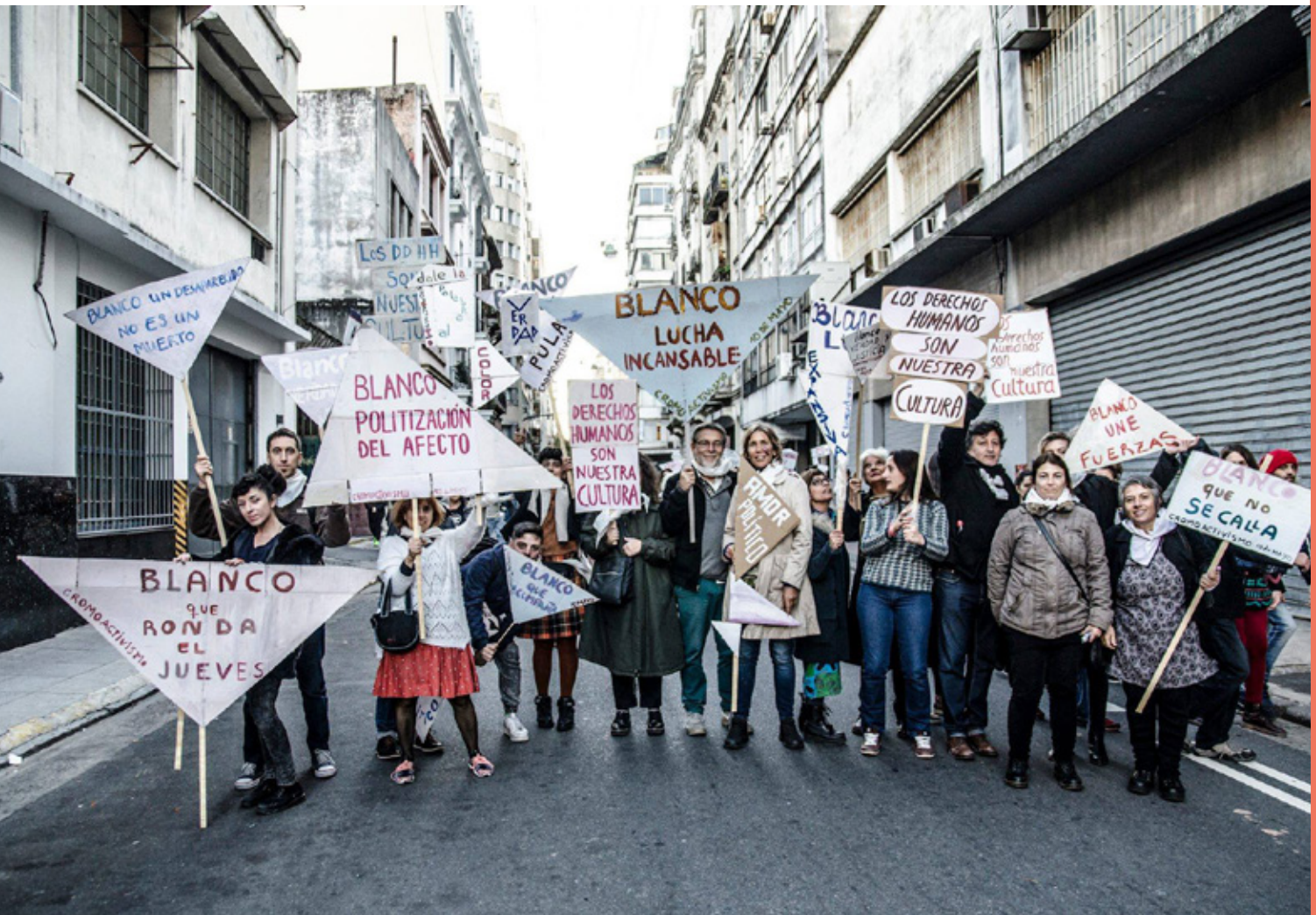
Cromoactivación Marcha 2X1 Nunca Más Cromoactivismo, 2017