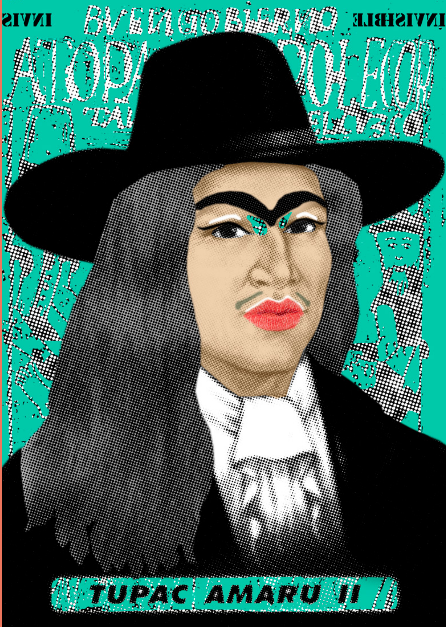
TUPAC AMARU II