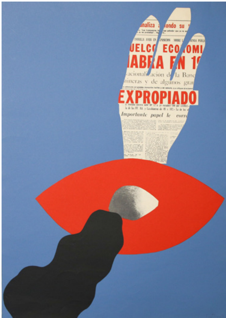
Tren de la cultura Luz Donoso, 1971