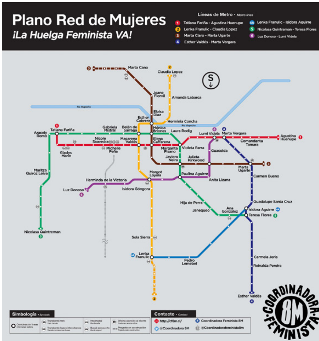
Plano Red de Mujeres ¡La Huelga Feminista VA! #SuperLunesFeminista Brigada Laura Rodig, 2019